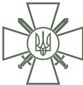
СУХОПУТНА АРМІЯ, 166 тис. 580 осіб, 2322 танка.