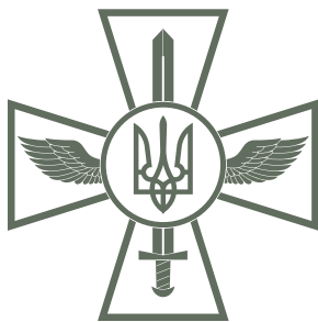
ПОВІТРЯНІ СИЛИ, 42 тис. 250 осіб.

В основі нових Збройних Сил України – три види військ: